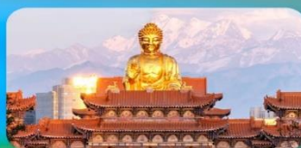
วัดพระใหญ่หรงกงชาน