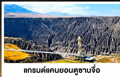
แกรนด์แคนยอนคุชานจือ