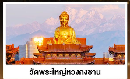
วัดพระใหญ่หวงกงซาน