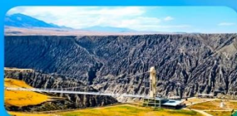
แกรนด์แคนยอนดูซานจื่อ