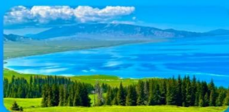
ทะเลสาบไซ่หลี่มู่