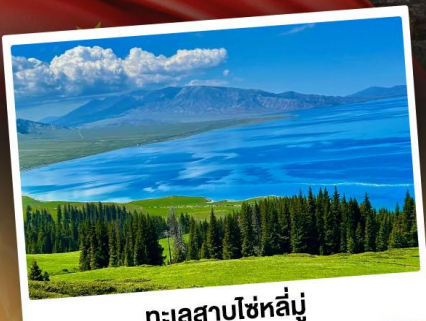
ทะเลสาบไซท์ลี่

ชมวิวสุดอลังการแบบยุโรปผสมเอเชีย ทุ่งหญ้าเขียวฉ่ำ ทะเลสาบสีเทอร์ควอยซ์