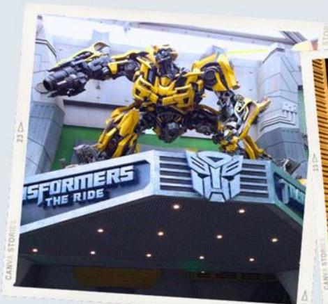
ZONE 1 : HOLLYWOOD