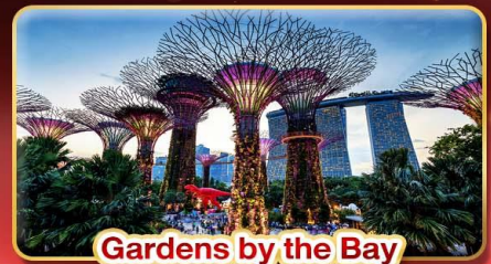
Gardens by the Bay