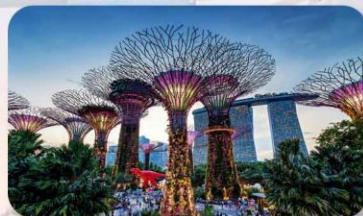
Gardens by the Bay