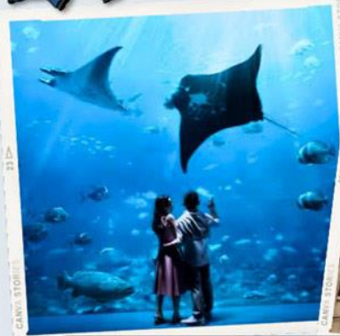
ZONE 7 : FAR FAR AWAY